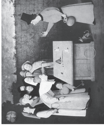
L'Escamoteur, Jérôme Bosch

C ERTAINS OPPOSANTS À CIGÉO proposent des alternatives pour stocker les déchets nucléaires destinés à l'enfouissement profond, en particulier l'entreposage à sec de longue durée de ces déchets radioactifs en surface ou en subsurface. Ils cherchent ainsi à répondre à la question-piège : « Et les déchets qui sont déjà là, qu'est-ce qu'on en fait ? » Or le problème actuel de l'industrie